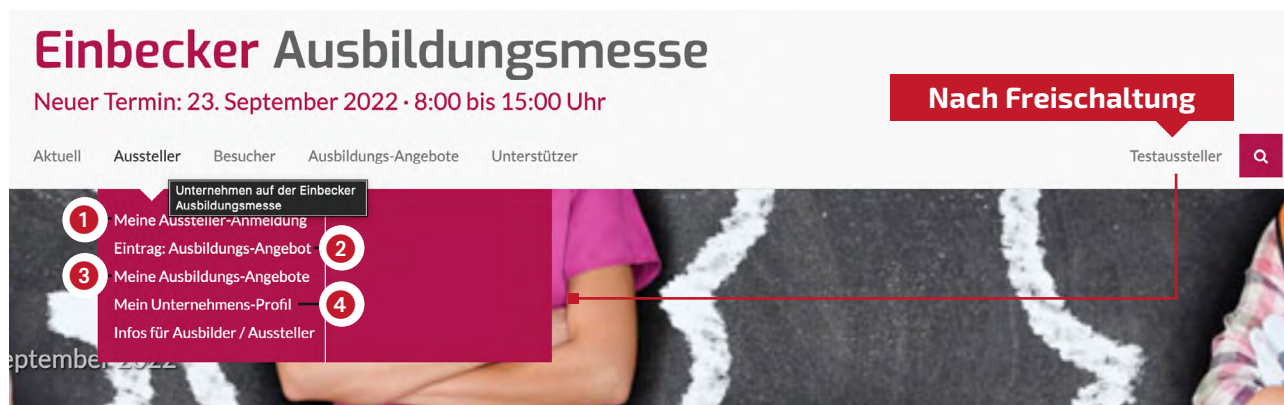
Abb. 3: Erweitertes Menü nach Freischaltung, hier mit Registrierungs-Bereich „Aussteller“ (nicht sichtbar für die Registrierungs-Bereiche „Schulen“ und „Besucher“)

Jede Freischaltung wird schnellstmöglich bearbeitet, wir bitten Sie jedoch um etwas Geduld.